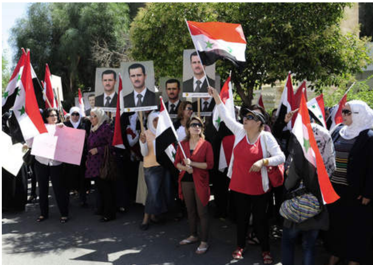
Syrische, Iraakse en Palestijnse vrouwen houden portretten van Assad omhoog om hun steun aan de Syrische leider te betuigen.

Mensen vergeten wel eens dat Nederland met zijn koloniën ooit het grootste moslimland ter wereld was.