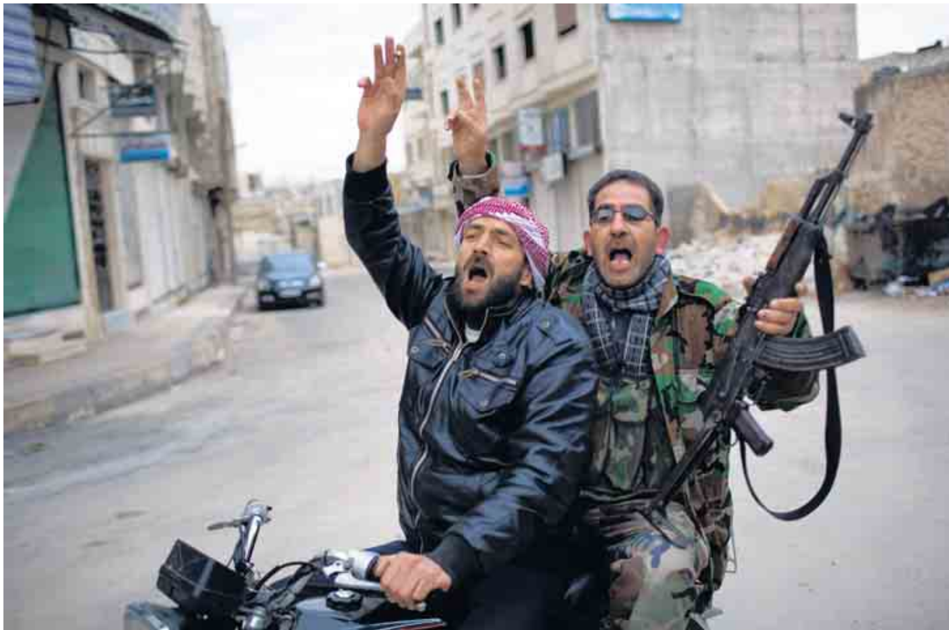
Syrische rebellen vieren de vernietiging van een tank van het regeringsleger in Idlib, Noord-Syrië.