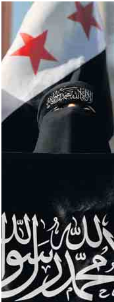
Een anti-Assadbetoging in Istanbul.

Heel de wereld kijkt dezer dagen naar Syrië. Maar wat weten we van het land? Onze Midden-Oostencorrespondent Jorn De Cock raadt zes verhelderende boeken aan die inzicht verschaffen in een ondoordringbaar land.